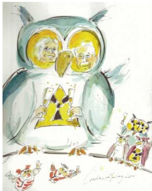
94 Eine ganz persönliche Gratulation für 2 Strahlenschützer