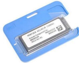
Abbildung 2: Beispiel für Personendosimeter

Sowohl durch technische und medizinische Anwendungen als auch durch natürlich in der Umwelt vorkommende Strahlung werden Menschen einer Strahlendosis ausgesetzt. Die durchschnittliche jährliche Strahlenexposition in Deutschland und in der Schweiz beträgt ca. 4 mSv und unterscheidet sich unter anderem je nach Wohnort und medizinischem Bedarf deutlich.