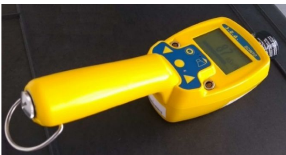
Abbildung 1: Gerät "Scinto" als Beispiel für Ortsdosimetrie

Eine Messung kann für einen bestimmten Ort im Raum als sogenannte Ortsdosimetrie durchgeführt werden. Anhand der Messwerte und der Aufenthaltsdauer kann dann die Dosis für eine bestimmte Person individuell berechnet werden. Ortsdosimetrie wird beispielsweise flächendeckend genutzt, um die Strahlenexposition in Deutschland im Rahmen des Messnetzes IMIS (Bundesamt für Strahlenschutz) zu beobachten. Handgeräte können als Strahlungsmonitore zur Ortsdosimetrie verwendet werden (Abb.1).