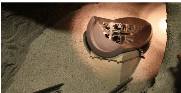
Demonstrationsversuch des Einlagerungskonzeptes für hochaktive Abfälle (Felslabor Grimsel, CH)

Mit fundiertem Fachwissen setzen wir uns beständig ein für den Schutz von Mensch und Umwelt vor Gefährdungen durch Strahlung in Medizin, Forschung, Industrie und bei natürlichen Strahlenquellen. Auch bei Not- und Unfällen berät und informiert der Fachverband die Öffentlichkeit - unabhängig und kompetent. Weitere Info-Blätter: www.strahlenschutzkompakt.de