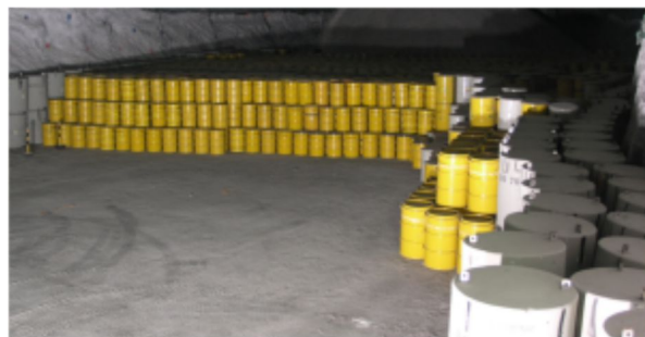
Behälter mit Abfällen mit vernachlässigbarer Wärmeentwicklung im Endlager Morsleben

begrenzte Aufgabe. Irgendwann ist die Radioaktivität jedes Stoffes so weit abgeklungen, dass keine Gefahr mehr davon ausgeht.