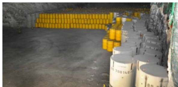
Behälter mit Abfällen mit vernachlässigbarer Wärmeentwicklung im Endlager Morsleben

begrenzte Aufgabe. Irgendwann ist die Radioaktivität jedes Stoffes so weit abgeklungen, dass keine Gefahr mehr davon ausgeht.