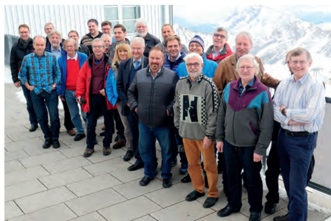
106 Eine Tagung mit Ausblick hatten die Teilnehmer der 97. Sitzung des AKU im März 2017 im Schneefernerhaus unterhalb des Zugspitzgipfels.

Arbeitskreise und Arbeitsgemeinschaften des FS 101