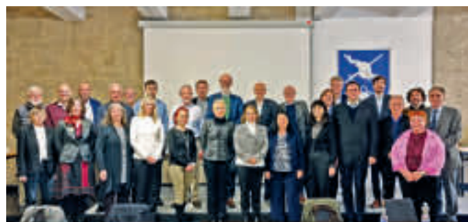
68 Blick auf die Teilnehmer:innen des 19. Treffens der europäischen IRPA-Gesellschaften in München.