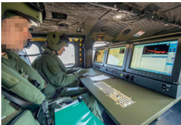
14 Blick in einen Radiometrie-Helikopter, der zur Ermittlung der radiometrischen Lage am Boden eingesetzt wird.